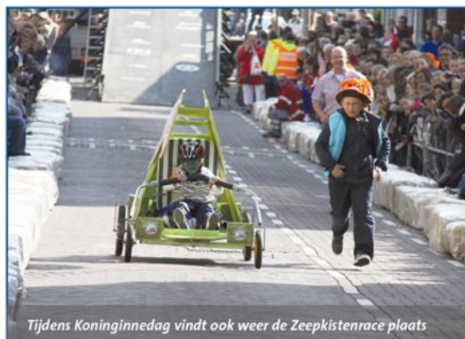
Tijdens Koninginnedag vindt ook weer de Zeepkistenrace plaats

Op Koninginnedag wordt het centrum van Zandvoort weer omgetoverd tot een waar zeepkistencircuit. Exact om 16.15 uur klinkt het eerste startsein voor de Zeepkistenrace Zandvoort 2011 en zullen de snelheidsduivels weer vanaf de Oranjestraat naar beneden razen.