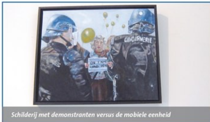
Schilderij met demonstranten versus de mobiele eenheid