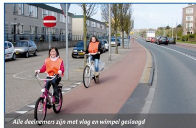
Alle deelnemers zijn met vlag en wimpel geslaagd

Afgelopen dinsdag hebben de leerlingen van de groepen 7/8 van de Zandvoortse basisscholen weer hun verkeersexamen afgelegd. Na een theoretisch gedeelte gingen de kinderen ook de weg op waarbij een parcours, met allerlei moeilijkheden, moest worden gevolgd.