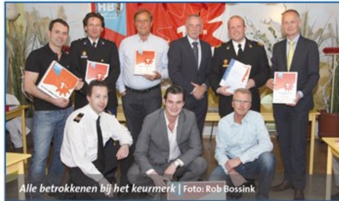
Alle betrokkenen bij het keurmerk

Vorige week donderdag vond, tijdens de ledenvergadering van de Ondernemers Vereniging Zandvoort, de ondertekening plaats van het convenant Keurmerk Veilig Ondernemen (KVO) winkelgebied Zandvoort Centrum. Uitgangspunt is een duurzame samenwerking tussen de gemeente, brandweer, politie, OVZ en het Hoofdbedrijf-schap Detailhandel.