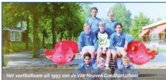
Het voetbalteam uit 1993 van de Van Heuven Goedhartschool