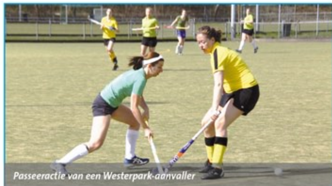
Passeeractie van een Westerpark-aanvaller